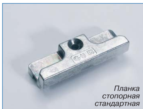
Планка стопорная стандартная