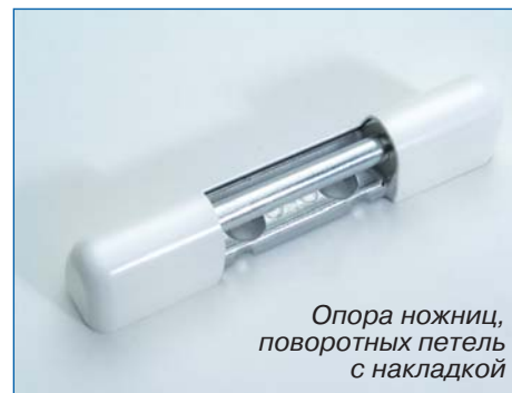
Опора ножниц, поворотных петель с накладкой