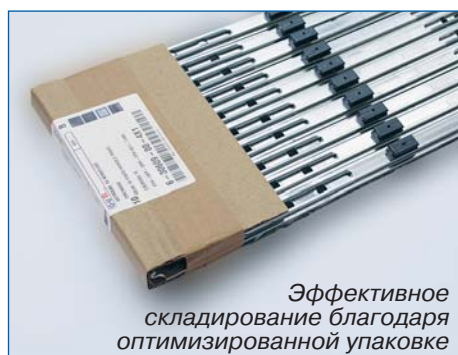
Эффективное складирование благодаря оптимизированной упаковке