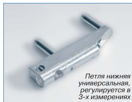
Петля нижняя универсальная, регулируется в 3-х измерениях