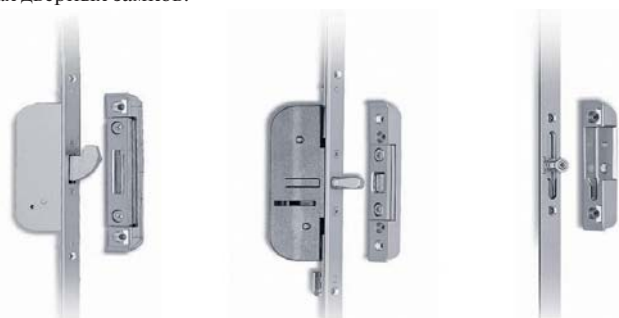
Запорный крюк Стальной штырь i.S.-цапфа

Программа MACO PROTECT представлена в трех различных системах дверных замков: