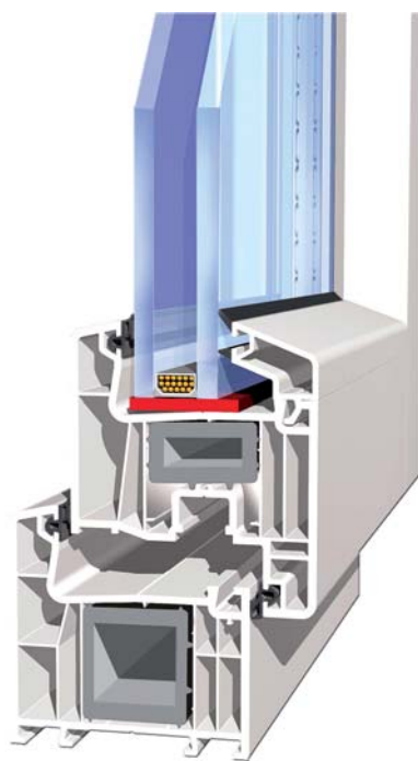
Профильная система Thermotech