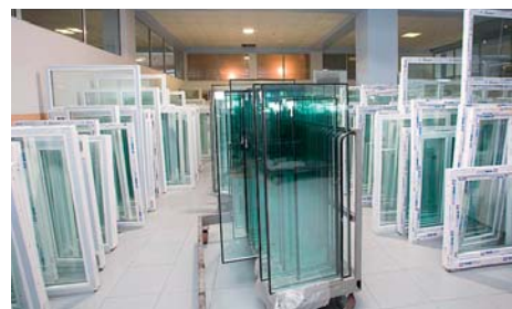
Окна Wintech готовы отправиться к своим владельцам. На фото склад компании «Элит Лайн» (Иркутск)