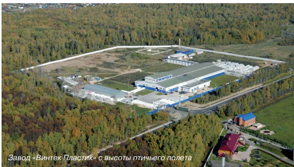
Завод «Винтек Пластик» с высоты птичьего полета

Радует, что прошедший сезон оказался для многих оконных компаний очень хорошим. От наших уважаемых конкурентов и клиентов мы слышим, что объем заказов от частных лиц вышел на докризисный уровень. Эта тенденция наблюдается с конца прошлого года. Однако потребности клиентов претерпевают существенные изменения. Так, брендовая составляющая предложения играет все меньшую роль, а наиболее значимым становится соотношение цена/качество. В связи с этим производители светопрозрачных конструкций стремятся оптимизировать свои продуктовые линейки соответствующим образом, уходя от мономарочной политики. Активный рост продаж марки Wintech иллюстрирует эту тенденцию.