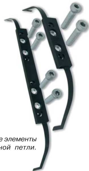
Закладные элементы для тройной петли. Арт. 6621