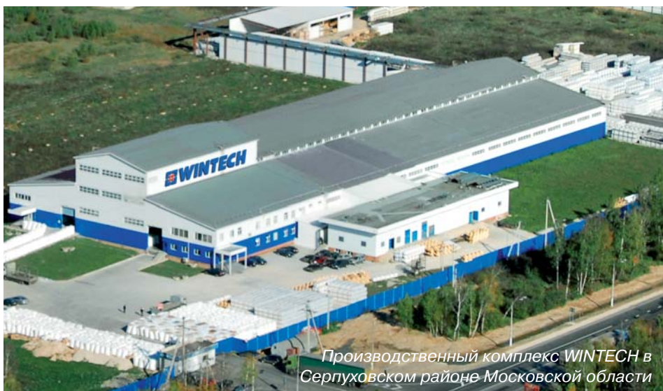
Производственный комплекс WINTECH в Серпуховском районе Московской области

WINTECH использует уплотнитель собственного производства серого и черного цветов. Оптимальная форма и улучшенная рецептура позволили уплотнителю от WINTECH блестяще выдержать испытания русской зимой.