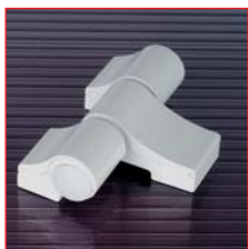
Трехсекционная петля LOIRA+

Начнем знакомство с петлей с внешних отличий. Корпус и наружные крышки выполнены из экструдированного профиля. Петля лишилась мягких, закругленных форм, но приобрела четко выраженные контуры. Крышка значительно увеличилась в размерах и теперь почти полностью обхватывает корпус. Благодаря этому исчезла линия разъема «корпус/крышка» с видовой поверхности. В предыдущих семействах петля верхняя и нижняя крышки выполняли роль фиксаторов регулировок, в новом семействе – это декоративные крышки с простой фиксацией. Вот, пожалуй, и все видимые отличия. Основные новшества находятся внутри петли, о чем мы сейчас и будем подробно рассказывать.