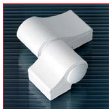
Двухсекционная петля LOIRA+