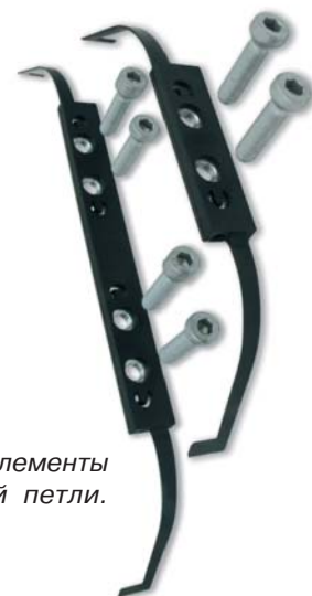
Закладные элементы для тройной петли. Арт. 6621