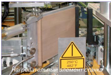
Нагревательный элемент станка

Компания «Форвард-Комплект» 13 лет успешно работает на рынке термостойких, антиадгезивных, износостойких материалов, в том числе для оконного производства и является эксклюзивным дистрибьютором компании «Fiberflon® A.S.» по поставкам материалов с тефлоновым покрытием на территории РФ. «FORFLON®» – зарегистрированная торговая марка в России.