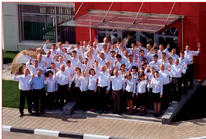
Технические консультанты и представители Roto Frank в регионах России

тимента продукции. Так, например, нестандартные системы фурнитуры стали более доступными для клиентов, так как теперь существует возможность быстрого реагирования на любые запросы дилеров и переработчиков. Срок поставки сократился от нескольких месяцев до 1-2 недель.