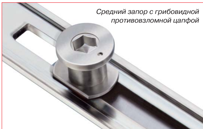
Средний запор с грибовидной противовзломной цапфой