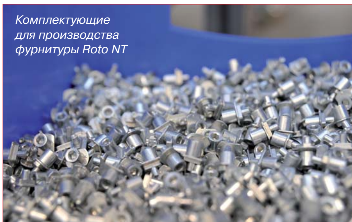
Комплектующие для производства фурнитуры Roto NT