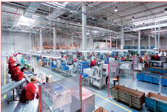
Монтажные производственные линии