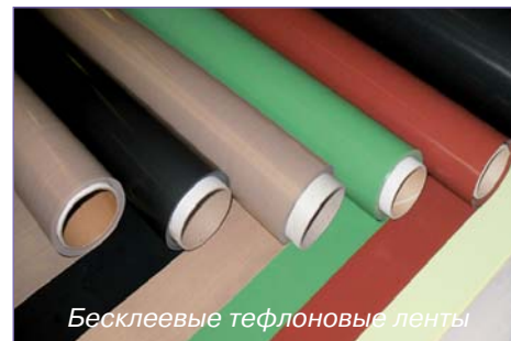
Бесклеевые тефлоновые ленты

Т ефлоновые ленты Forflon® от «Форвард-Комплект» решают проблему защиты термосваривающихся элементов оборудования для сварки ПВХ-профиля, сохраняя тепловой поток от нагревательного элемента к свариваемым материалам. Разумеется, на надежность сварочного шва влияет качество тефлоновых лент, а их цена естественным образом сказывается на готовой продукции.