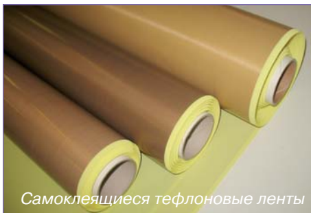
Самоклеющиеся тефлоновые ленты