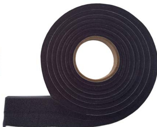
Лента ПСУЛ – Робибанд