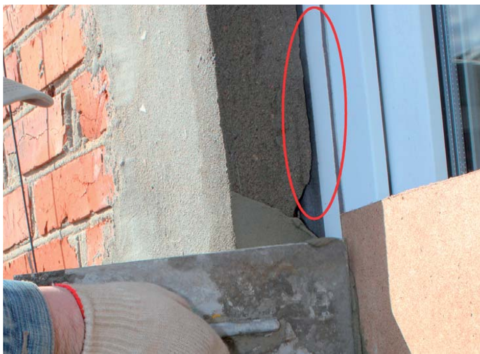
Финишная отделка откоса может быть выполнена в любое удобное время

Таким образом оба продукта – ПСУЛ и КМП – полностью удовлетворяют требованиям ГОСТ по монтажу, и выбор того или иного из них зависит от особенностей установки оконного блока и состояния оконного проема.