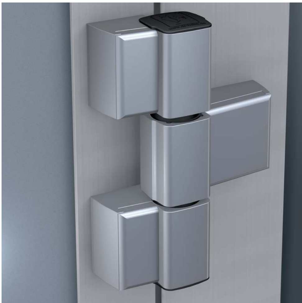
Новая петля Serie 60 AT (трехсекционное исполнение)