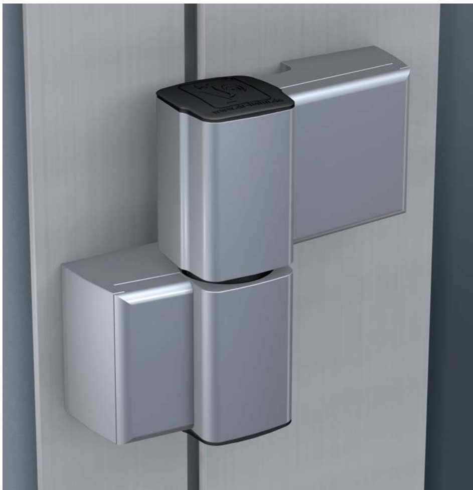
Новая петля Serie 60 AT (двухсекционное исполнение)

Еще одним приятным сюрпризом для производителей станет новая опция упаковки петель. Теперь петли с разным межосевым расстоянием доступны также в популярных промышленных упаковках по 24 шт. (для двухсекционных петель) и по 18 шт. (для трехсекционных петель).