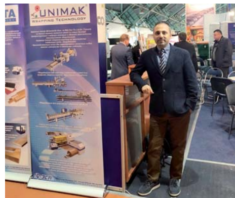
«Унимак» на выставке Деревообработка – 2018 в г. Минске (Беларусь)