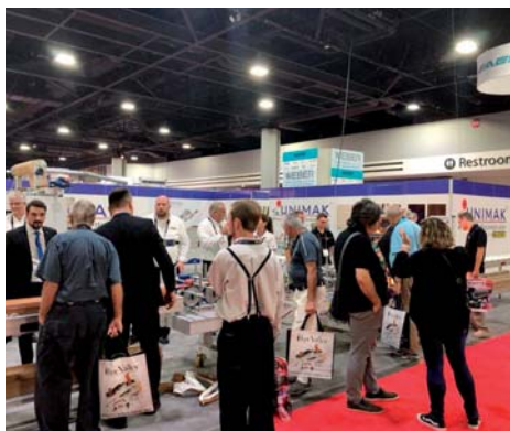
«Унимак» на выставке IWF в г. Атланте (США)

Благодарим всех гостей за посещение нашего стенда. Все посетители имели возможность посмотреть наше оборудование в работе, убедиться в качестве окутывания профиля, а также получить всю необходимую информацию.