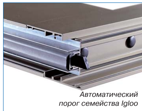
Автоматический порог семейства Igloo