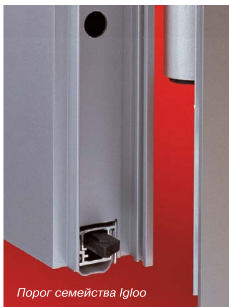
Порог семейства Igloo