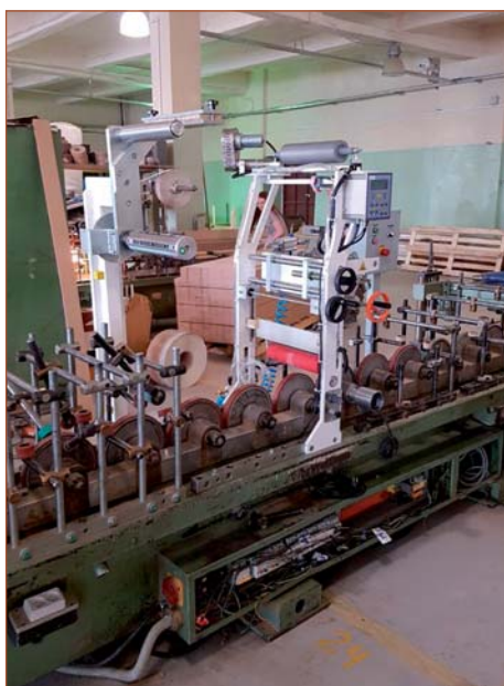
Переоборудование компанией «Экстру-Тех» ламинатора FRIZ на ПУР-систему