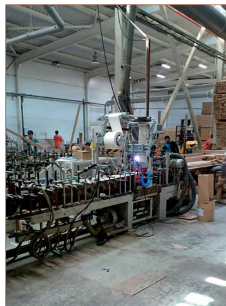
Переоборудование компанией «Экстру-Тех» ламинатора китайского производства на ПУР-систему