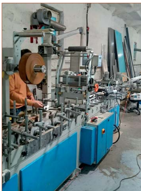
Переоборудование компанией «Экстру-Тех» ламинатора FUX на ПУР-систему

Итак, чтоб перевести (модернизировать) ламинационный станок на ПУР-клеи-расплавы (иными словами, горячие клеи), потребуется ламинационный станок (работающая станина с транспортными колесами, прижимными роликами) и желательна электросхема к нему. Станок может быть любого производства, будь то Испания, Германия, Турция, Китай. Самый старый станок, который нам довелось перевести на ПУР-клей-расплав, был 1978 года производства, выпущен компанией FRIZ. При проведении модернизационных работ на станину станка устанавливается ПУР-станция (состоящая из пневматического вала размотки с электромагнитным тормозом, оптической электронной системы,