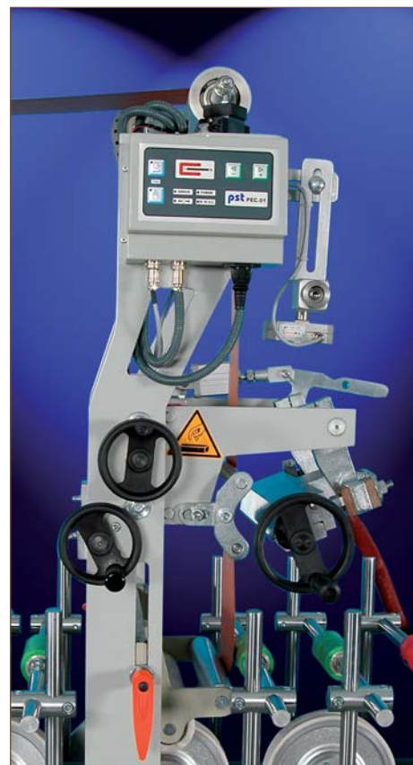
LM 300 W6 P. ПУР-система, вид оптической электронной системы

В последние годы спросом пользуются станки, позволяющие без остановки ламинировать один и тот же профиль различными цветными пленками. Благодаря устройству автоматической смены пленки станок может работать без остановки на смену бобины, что позволяет уменьшить количество отбраковки пленки и существенно экономит время.