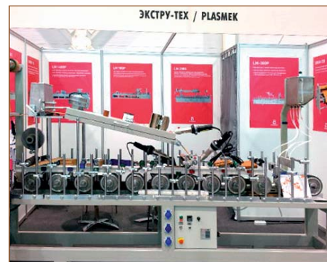
Мини-станок для ламинации. Скорость ламинирования до 12 м/мин