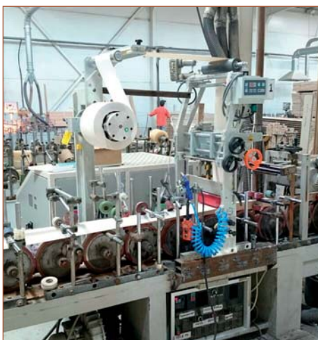
Переоборудование компанией «Экстру-Тех» ламинатора китайского производства на ПУР-систему

дюза, первого прижимного вала) с плавильником (мощность и объем плавильника подбирается в зависимости от профилей, объемов клиента и желаемой скорости ламинирования). Производятся электромонтажные работы со шкафом управления станка. Для этого желательно иметь электросхемы, впрочем, их отсутствие не критично, оно просто немного затормозит электромонтажные работы. Заключаящим этапом модернизации является синхронизация работы станка с ПУР-плавильной станцией. Ниже приведены фотографии станков с установленными на них нашими ПУР-плавильными станциями.