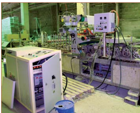
Китайский ламинационный станок с шириной ламинации до 900 мм, переделанный компанией «Экстру-Тех» под ПУР-систему

ООО «ТПК «Экстру-Тех» 140054, Московская обл., Люберецкий р-н, г. Котельники, микрорайон Ковровый, д. 37 (территория комбината «Люберецкие ковры») +7 (495) 783-3136 (АТС Коврового комбината) доб. 183 – тел./факс, доб. 184 – тел. Тел.: +7 (916) 641-0723 E-mail: extru-tech@mail.ru www.extru-tech.ru