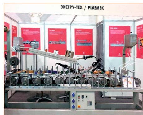
Мини-станок для ламинации. Скорость ламинирования до 12 м/мин