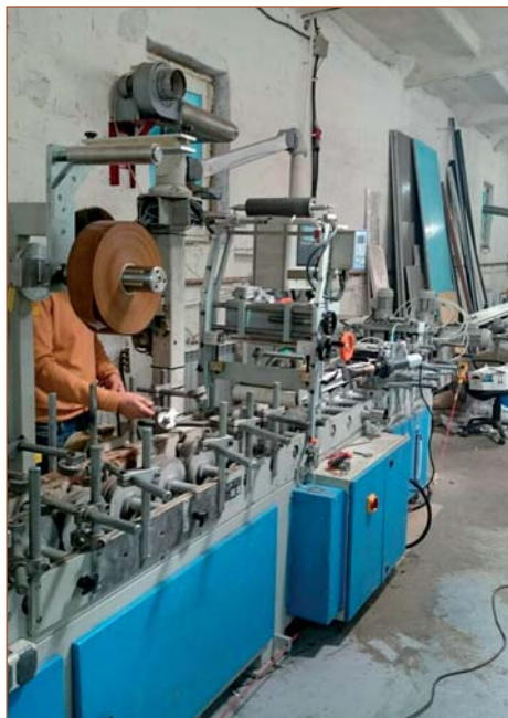
Переоборудование компанией «Экстру-Тех» ламинатора FUX на ПУР-систему

Итак, чтоб перевести (модернизировать) ламинационный станок на ПУР-клеи-расплавы (иными словами, горячие клеи), потребуется ламинационный станок (работающая станина с транспортными колесами, прижимными роликами) и желательно электросхемы к нему. Станок может быть любого производства, будь то Испания, Германия, Турция, Китай. Самый старый станок, который нам довелось перевести на ПУР-клей-расплав, был 1978 года производства, выпущен компанией FRIZ. При проведении модернизационных работ на станину станка устанавливается ПУР-станция (состоящая из пневматического вала размотки с электромагнитным тор-