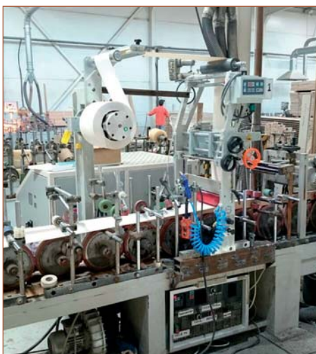
Переоборудование компанией «Экстру-Тех» ламинатора китайского производства на ПУР-систему

мозом, оптической электронной системы, дюзы, первого прижимного вала) с плавильником (мощность и объем плавильника подбирается в зависимости от профилей, объемов клиента и желаемой скорости ламинирования). Производятся электромонтажные работы со шкафом управления станка. Для этого желательно иметь электросхемы, впрочем, их отсутствие не критично, оно просто немного затормозит электромонтажные работы. Заключаящим этапом модернизации является синхронизация работы станка с ПУР-плавильной станцией. Ниже приведены фотографии станков с установленными на них нашими ПУР-плавильными станциями.