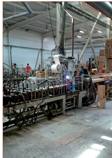
Переоборудование компанией «Экстру-Тех» ламинатора китайского производства на ПУР-систему