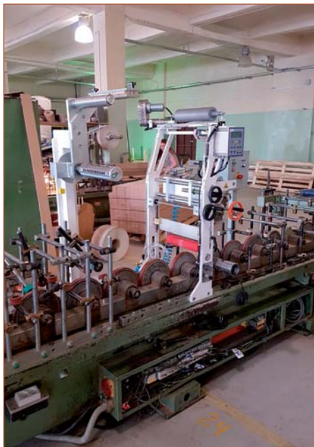
Переоборудование компанией «Экстру-Тех» ламинатора FRIZ на ПУР-систему