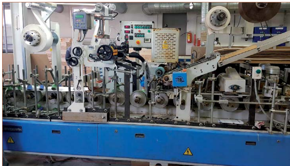
Переоборудование компанией «Экстру-Тех» ламинатора Barberan на ПУР-систему

Только за последние 10 лет наша компания провела более 200 аналогичных модернизаций на станках разной ширины (от 300 до 1400 мм). Еще раз хотим отметить, что при смене систем клеенанесения следует учитывать, что ПУР-система, которая будет устанавливаться на станок, это не просто «дюза + шланг + плавильник», это целая установка, включающая в себя размоточный пневматический вал (один либо два, все зависит от технических задач и того, где будет эксплуатироваться ламинаторный станок: в составе экструзионной линии или нет), оптическую систему, нагревательные элементы, плавильник и все необходимые опции к нему, а также то, что меняются электрические соединения в шкафу управления, производится синхронизация ПУР-системы с работой ламинаторной установки и иногда экструзионной линии (если станок используется в составе экструзионной линии).