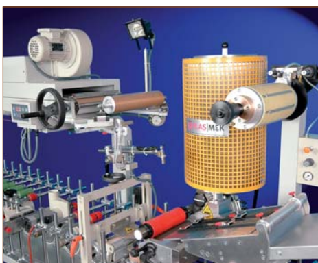
EVA и двухкомпонентная холодная система

В последние годы спросом пользуются станки, позволяющие без остановки ламинировать один и тот же профиль различными цветными пленками. Благодаря устройству автоматической смены пленки станок может работать без остановки на смену бобины, что позволяет уменьшить количество отбраковки пленки и существенно экономит время.