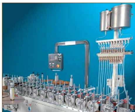
Система автоматизированной подачи праймера на станке