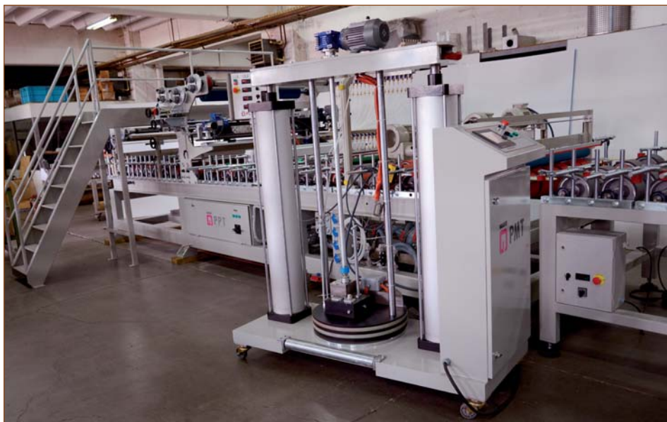
Ламинационный станок на клеe-расплаве (бочковой плавильник под 200 кг фасовку клея) для профилей шириной до 1000 мм

И в том и в другом случае, независимо от типа клея, осуществляется подготовительная