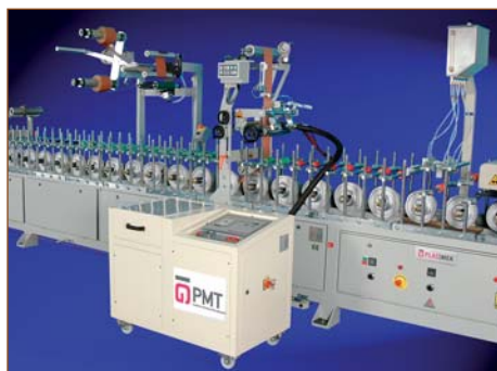
Ламинационный станок для ПВХ- и алюминиевых профилей, работающий на ПУР-клее-расплаве, модель LM300-W6-Pur

В настоящее время в производственной палитре оборудования для ламинирования/каширования профилей имеются станки, позволяющие наносить пленку, бумагу, меламин (как рулонный, так и листовой) и