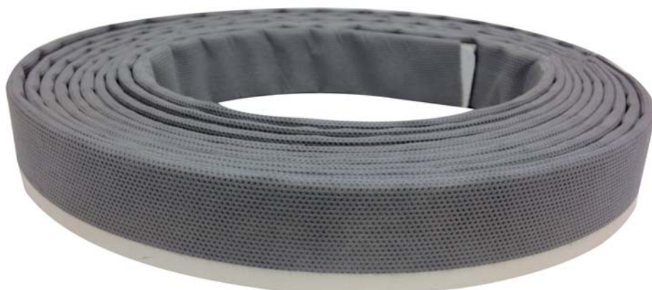
Лента Робибанд КМП

разрушенной четвертью (всей или ее частью) отсутствует полностью или частично вторая плоскость (первая – сама оконная конструкция) для опоры ПСУЛа и его физи-