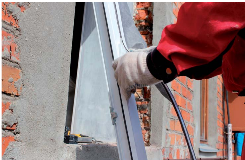
Приклеивание ленты КМП к оконной раме

Учитывая эти проблемы, а также то, что разрушенная или кривая четверть может быть скрыта от глаз монтажника до непосредственного демонтажа прежней конструкции, когда необходимо заниматься монтажом новой, а не искать подручные материалы для восстановления четверти, специалистами нашей компании был разработан новый продукт — Робибанд КМП (комбинированная многофункциональная паропроницаемая лента).