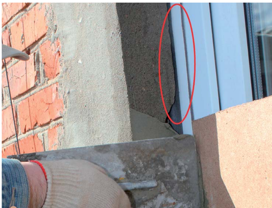
Финишная отделка откоса может быть выполнена в любое удобное время