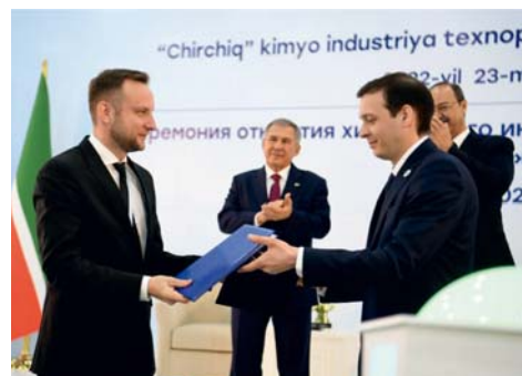
Открытие Завода «Стандарт Проф»® в Узбекистане