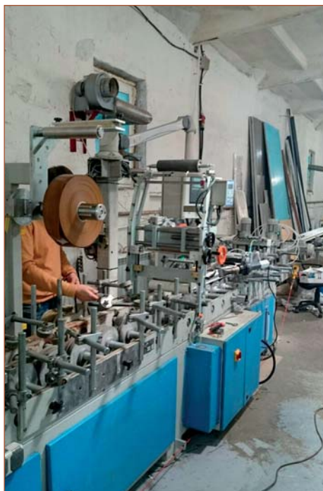
Переоборудование компанией «Экстру-Тех» ламинатора FUX на ПУР-систему

Итак, чтоб перевести (модернизировать) ламинационный станок на ПУР-клеи-расплавы (иными словами, горячие клеи), потребуется ламинационный станок (работающая станина с транспортными колесами, прижимными роликами) и желательнo электросхемы к нему. Станок может быть любого производства, будь то Испания, Германия, Турция, Ки-