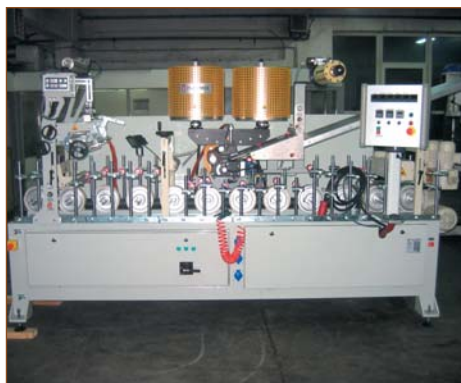
Станок для ламинирования с использованием EVA и PUR