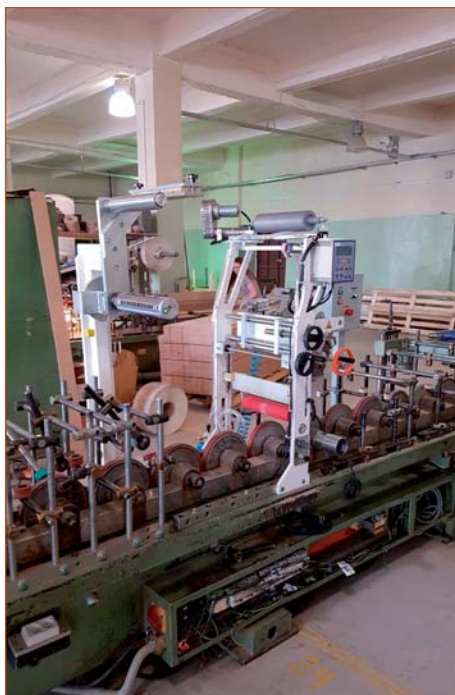
Переоборудование компанией «Экстру-Тех» ламинатора FRIZ на ПУР-систему