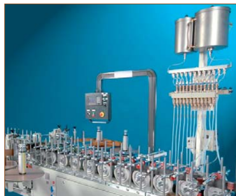
Система автоматизированной подачи праймера на станке