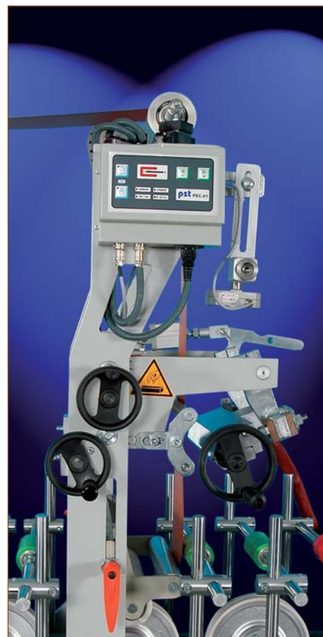
LM 300 W6 P. ПУР-система, вид оптической электронной системы

В последние годы спросом пользуются станки, позволяющие без остановки ламинировать один и тот же профиль различными цветными пленками. Благодаря устройству автоматической смены пленки станок может работать без остановки на смену бобины, что позволяет уменьшить количество отбраковки пленки и существенно экономит время.