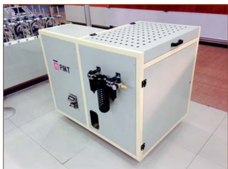
Ящичный плавильник PMT 100 с системой осушки воздуха

обработка поверхности ПВХ-профиля (на поверхность профиля наносится праймер).