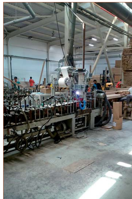
Переоборудование компанией «Экстру-Тех» ламинатора китайского производства на ПУР-систему