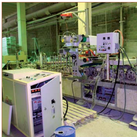
Китайский ламинаторный станок с шириной ламинации до 900 мм, переделанный компанией «Экстру-Тех» под ПУР-систему

тай. Самый старый станок, который нам довелось перевести на ПУР-клей-расплав, был 1978 года производства, выпущен компанией FRIZ. При проведении модернизационных работ на станину станка устанавливается ПУР-станция (состоящая из пневматического вала размотки с электромагнитным тормозом, оптической электронной системы, дюзы, первого прижимного вала) с плавильником (мощность и объем плавильника подбирается в зависимости от профилей, объемов клиента и желаемой скорости ламинирования). Производятся электромонтажные работы со шкафом управления станка. Для этого желательно иметь электросхемы, впрочем, их отсутствие не критично, оно просто немного затормозит электромонтажные работы. Заключаящим этапом модернизации является синхронизация работы станка с ПУР-плавильной станцией. Ниже приведены фотографии станков с установленными на них нашими ПУР-плавильными станциями.