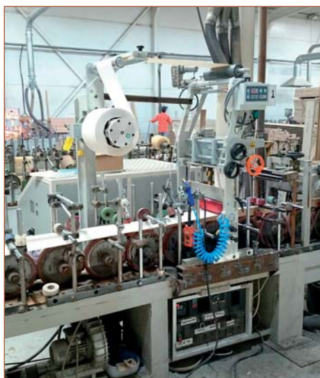
Переоборудование компанией «Экстру-Тех» ламинатора китайского производства на ПУР-систему

тай. Самый старый станок, который нам довелось перевести на ПУР-клей-расплав, был 1978 года производства, выпущен компанией FRIZ. При проведении модернизационных работ на станину станка устанавливается ПУР-станция (состоящая из пневматического вала размотки с электромагнитным тормозом, оптической электронной системы, дюзы, первого прижимного вала) с плавильником (мощность и объем плавильника подбирается в зависимости от профилей, объемов клиента и желаемой скорости ламинирования). Производятся электромонтажные работы со шкафом управления станка. Для этого желательно иметь электросхемы, впрочем, их отсутствие не критично, оно просто немного затормозит электромонтажные работы. Заключаящим этапом модернизации является синхронизация работы станка с ПУР-плавильной станцией. Ниже приведены фотографии станков с установленными на них нашими ПУР-плавильными станциями.