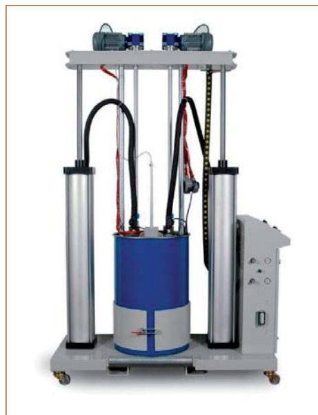
Бочковой плавильник PDM 20