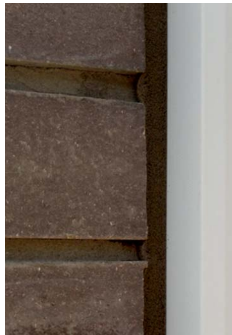
Внешний слой монтажного шва, выполненный с использованием ПСУЛ в соответствии с требованиями ГОСТ