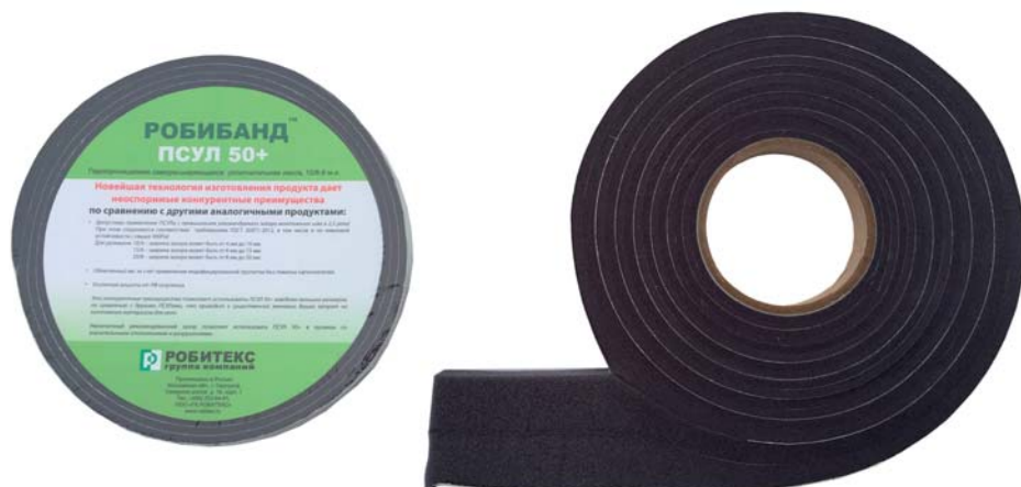
Лента ПСУЛ – Робибанд

верть оконного проема может быть частично разрушена (например, при демонтаже существующей конструкции), или иметь отклонение от вертикали. Тогда возникает проблема с правильностью и простотой исполнения работ в соответствии с