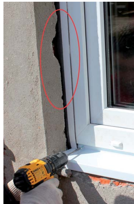
Вид установленной КМП-ленты до внешнего оштукатуривания

проема вниз. При этом мембрана верхнего отрезка должна заходить за мембрану нижнего отрезка, если смотреть со стороны помещения. Если ширина мембраны превышает требуемое значение, ее можно обрезать ножницами или ножом.