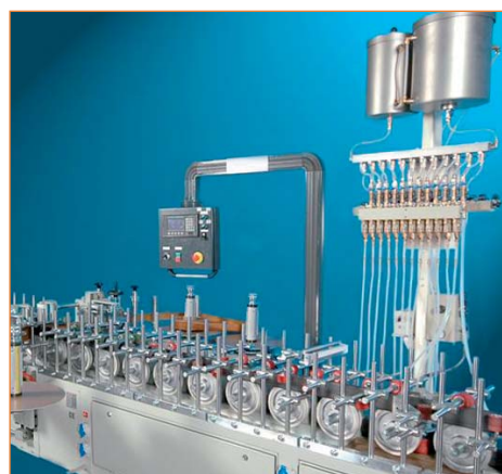
Система автоматизированной подачи праймера на станке