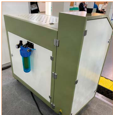
Ящичный плавильник с системой осушки воздуха

которая наносит расплавленный горячий клей на пленку строго на ширину выставленного размера и толщину клея (выставляется из учета расхода 40 – 60 граммов на 1 квадратный метр, в зависимости от особенностей ламинационного материала, его структуры и фактурности, от химического состава и характеристик клея и т. д.).