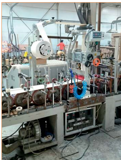
Переоборудование компанией «Экстру-Тех» ламинатора китайского производства на ПУР-систему

изводства, выпущен компанией FRIZ. При проведении модернизационных работ на станину станка устанавливается ПУР-станция (состоящая из пневматического вала размотки с электропневматическим тормозом, оптической электронной системы, дюзы, первого прижимного вала) с плавильником (мощность и объем плавильника подбирается в зависимости от профилей, объемов клиента и желаемой скорости ламинирования). Производятся электромонтажные работы со шкафом управления станка. Для этого желательно иметь электросхемы, впрочем, их отсутствие не критично, оно просто немного затормозит электромонтажные работы. Заключаящим этапом модернизации является синхронизация работы станка с ПУР-плавильной станцией. Ниже приведены фотографии станков с установ-