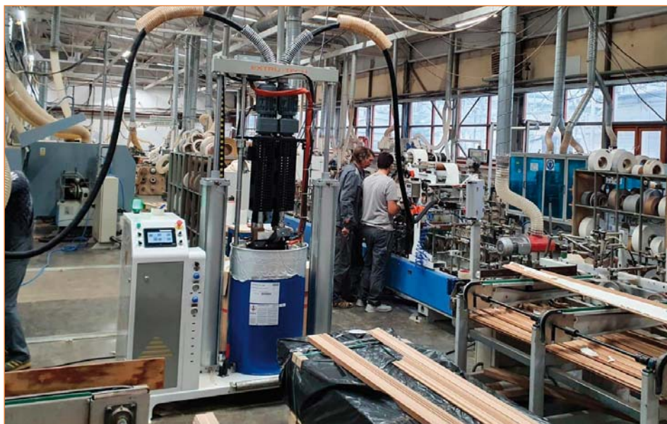
Бочковой плавильник на 200 кг клея под два шланга и два станка

По второй технологии клей-расплав в брикетах разогревается в специальном плавильнике (ящичном или бочковом) и через нагревательный шланг подается в дюзу. Дюза является своеобразной «кисточкой»,