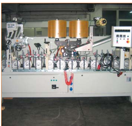
Станок для ламинирования с использованием EVA и PUR