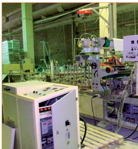
Китайский ламинаторный станок с шириной ламинации до 900 мм, переделанный компанией «Экстру-Тех» под ПУР-систему

изводства, выпущен компанией FRIZ. При проведении модернизационных работ на станину станка устанавливается ПУР-станция (состоящая из пневматического вала размотки с электропневматическим тормозом, оптической электронной системы, дюзы, первого прижимного вала) с плавильником (мощность и объем плавильника подбирается в зависимости от профилей, объемов клиента и желаемой скорости ламинирования). Производятся электромонтажные работы со шкафом управления станка. Для этого желательно иметь электросхемы, впрочем, их отсутствие не критично, оно просто немного затормозит электромонтажные работы. Заключаящим этапом модернизации является синхронизация работы станка с ПУР-плавильной станцией. Ниже приведены фотографии станков с установ-