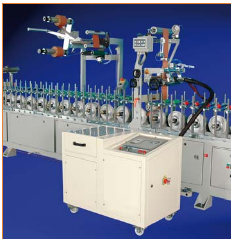
Ламинационный станок для ПВХ- и алюминиевых профилей, работающий на ПУР-клее-расплаве

Для работы с полиуретановым клеем (клем-расплавом, хотмелтом, горячим клеем) используют плавильники. Плавильники могут быть разных видов: ящичные (на 18 – 20, 50 и 100 кг/литров загрузки клея) и бочковые (на 18 – 20 и 200 кг загрузки клея). В не-