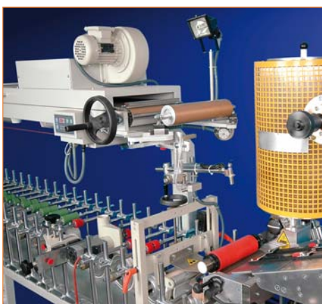
EVA и двухкомпонентная холодная система