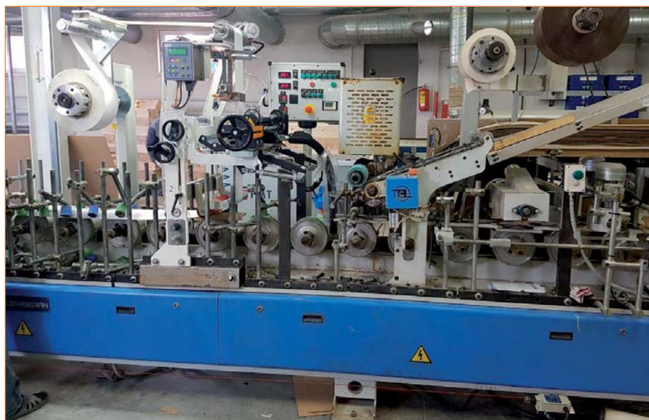
Переоборудование компанией «Экстру-Тех» ламинатора Barberan на ПУР-систему

ленными на них нашими ПУР-плавильными станциями.